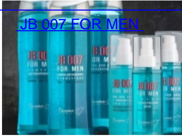
JB 007 FOR MEN