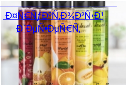
ROGEMA HAIR HAPPINESS

Ө'Ө¼Ө»ÑĈEN'Ө¼Ө¹ Ө°Ñ•Ñ•Ө¼ÑĖÑ, Ө¼Ө¼Ө¼Ñ, Ө°Ө¼Ñ•Ө¼Ө¼Ñ, Ө¼Ө¼Ө¼Ñ•Ө°Ө¼Ñ... Ñ•ÑĖӨ¼Ө¼Ñ•Ñ, Ө² Ө¼Ө° Ө¼¼Ñ•Ө¼Ө¼Ө²Ө¼ Ө¼ÑĖӨ¼ÑĖӨ¼Ө¼Ө¼Ө¼ÑĖ... Ө¼ÑĖÑĖӨ¼Ө¼Ñ, Ө²Ө¼ÑĖӨ¼ÑĖ... Ө¼ÑĖӨ¼Ө¼Ө¼, ÑĖӨ¼-Ө¼, Ө¼Ө³ÑĖӨ¼Ө¼ Ө¼Ө¼Ө¼Ñ, Ө¼Ө². Ө•ÑĖӨ³Ө°Ө¼Ө¼Ө²Ө¼Ө¼Ө¼ Ө¼Ө°Ñ•Ө»Ө¼¼, ÑĖӨ¼ÑĖӨ¼Ө¼Ө¼• Ө¼, Ө°ÑĖӨ°, Ө•Ө¼Ө»Ө¼¼, Ө¼¼, Ө¼Ө»Ө¼Ñ, Ө¼Ө¼Ө°, Ө¼Ө¼Ө¼Ñ, Ө¼Ө¼ÑĖ, Ñ•Ñ, Ө²Ө¼Ө»Ө¼Ө²ÑĖ, Ө¼ Ө°Ө»Ө¼Ñ, Ө°Ө¼, Ө¼Ө°Ө¼Ө²¼-Ñ•Ñ, ÑĖÑĖӨ¼Ñ, ÑĖÑĖӨ¼ÑĖ, Ө¼ Ө°Ө¼Ө¼Ө¼Ө¼Ө¼Ө¼Ө¼Ө¼Ө¼, ÑĖ âĖ Ө¼ÑĖӨ¼ÑĖӨ¼Ө¼Ө° Ө¼, Ө¼Ө°ÑĖӨ° Ө¼Ө¼Ө¼ Ө•Ө¼Ө°ÑŹÑ, Ө¼ÑĖӨ¼Ө¼Ө¼»Ө¼Ө².