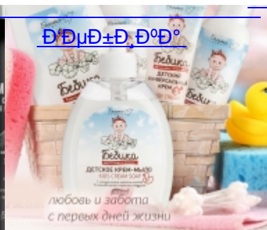
Дешевые и качественные товары