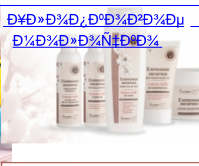
Дешевые и качественные товары