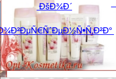
Дешевые и качественные товары