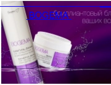
РОГЕМА криллиантовый бл ВАШИХ ВО