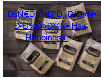
ROGEMA HAIR HAPPINESS