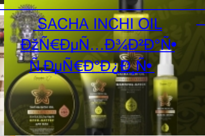
SACHA INCHI OIL